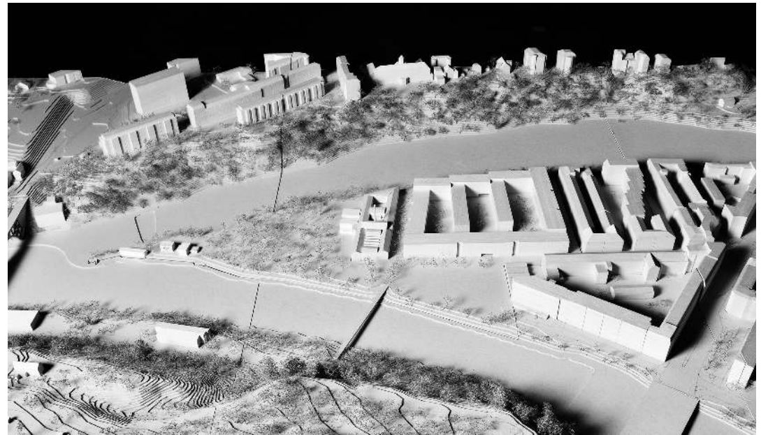
A gauche, vue aérienne de la pointe de la Jonction. A droite, la maquette de la vision projectuelle «Déployer».